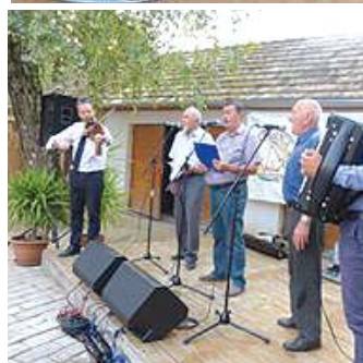
További képek megtekinthetők a www.medinafalu.hu oldalon

ség, ami néha már gyűlöletté fajul. Ami nem méltó a múlthoz, keserűvé teszi a jelent, és a jövő sem lesz boldogabb tőle.