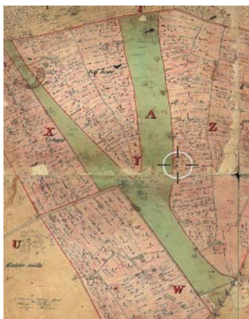
Vig hegy és a Pálénka' ház