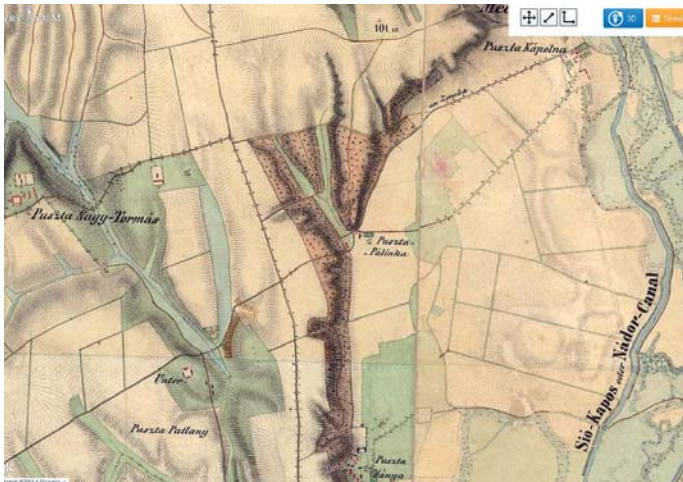
II. katonai felmérés térképe