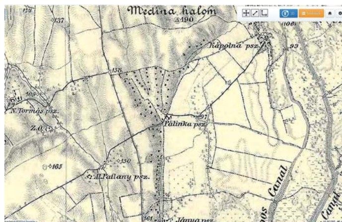
III. katonai térképen szereplő Pálinka puszta

A Dóri birtokhoz Nagytormás, Pusztatormás, Alsó, - és felső Patlany pusztája is hozzá tartozott. A birtokuk egészen a zombai határig húzódott. (Mai Kocsis féle ház előtt elvezető út is oda vitte a gyalogosokat, és az arra járókat.)