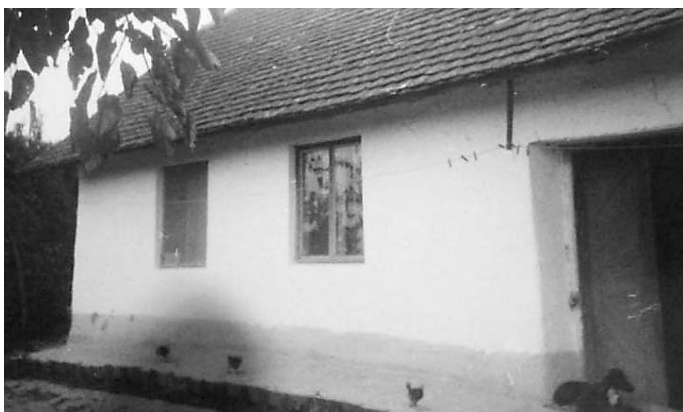
1896-ban vásárolt szülői ház Medina-Szőlő-hegyen