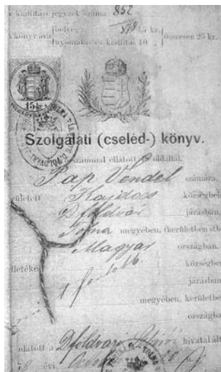
Szolgálati cseledtkönyv 1878-ból

A nagymama a Dóri birtok konyháján dolgozott szorgos kezeivel, és készítette el az uraság asztalára a legfinomabb ételeket, de ugyanitt a szennyes ruhák házi szappannal és mosófával történő mosása is rá lett bízva. Leleményessége, rátermettsége idővel megtérült, és meghozta a gyümölcsét. Faddról a csikós tűzhelyhez gyalog hozta el a fején a vasalkatrészeket, aztán ő építette meg a sokoldalú főzési lehetőséget kínáló tűzhelyet. Ezen a tűzhelyen kezdett el főzni, így vált lehetővé, hogy az eddigi egy fazék helyett több fazékban rotoghatott az étel. A rántás készítése is ezekből az időkől származik.